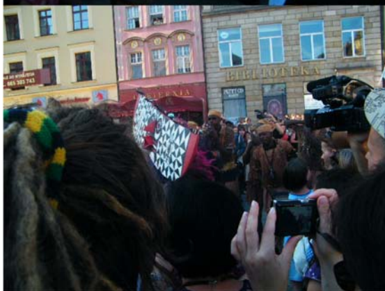
Fot. Marcin Guzła